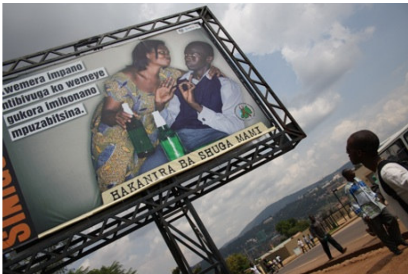
Figuur 7: Nationale preventiecampagne tegen sugar daddies / mummies

bestaan van oudere sugar daddies en sugar mummies en de mogelijke gevolgen van dergelijke relaties.