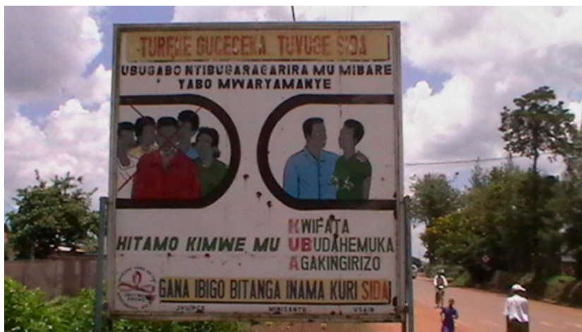
Figuur 4: Hiv-preventie door mannen aan te sporen om trouw te zijn aan één partner (maart 2010, Bugesera)

Daarnaast wordt in Rwanda onvoldoende aandacht besteed aan de seksuele en reproductieve gezondheid en rechten van tieners. Ze hebben bijvoorbeeld onvoldoende toegang tot seksuele vorming en informatie. Bestaande voorlichtingsprogramma's hebben weinig aandacht voor het aanleren van seksuele communicatie- en onderhandelingsvaardigheden, die jongeren onder meer kunnen aanleren hoe ze seksuele grenzen kunnen aangeven en respecteren. (UNAIDS, 1999, Jejeebhoy & Bott, 2003) In Rwanda maken de conservatieve attitudes ten opzichte van seksualiteit hiv-preventie moeilijk. Zo wordt er, vooral door jongeren, neergekeken op seks buiten het huwelijk en het gebruik van condooms (CNLS, 2009, p.30).