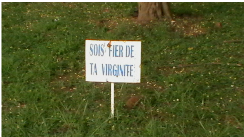
Figuur 8: Promotie van onthouding in een middelbare school (maart 2010, Nyamata)

De respondenten melden dat er qua tradities en cultuur veel veranderingen zijn ten opzichte van vroeger. De meisjes vinden dat de traditionele cultuur door de invloed van “ontwikkeling” en “modernisering” wordt aangetast. Belangrijke culturele waarden zouden daardoor verloren gaan en jongeren zouden “stiekem seks hebben” in plaats van naar hun ouders te luisteren. Zoals een meisje van Apebu het verwoordt: “Jongeren van tegenwoordig zijn niet meer zoals jongeren in het verleden.”