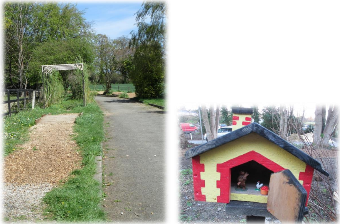
Figuur 9: Therapeutisch pad met brug, stenen, houtschiffers. Voor het stimuleren van geluiden en gevoelens

Meer voorbeelden van deze materialen vindt u terug in bijlage nummer 5