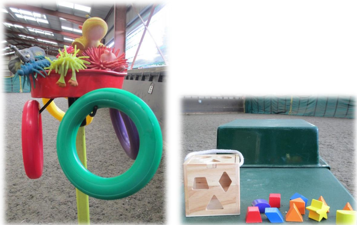
Figuur 8: materialen voor het oefenen van de fijne en grove motoriek

Voorbeelden van oefeningen zijn: pittenzakjes of speeltjes uit netjes halen en ze overbrengen naar een emmer of een ander netje. Tijdens dit proces wordt er geslalomd of van hand veranderd. Deze bewegingen zorgen ervoor dat de ruiter zijn balans dient te houden. Er wordt ook gebruik gemaakt van muziekblokjes. Een oefening met deze blokjes haalt de cliënt van de nek of het achterwerk van het paard, dit dient als stretch. Vervolgens wordt er muziek gemaakt en de coach zingt hierbij een liedje waarin hij opdrachten geeft aan de ruiter. Bijvoorbeeld de muziekblok hoog houden, of juist heel laag. Een andere oefening is zijwaarts of achterwaarts op de pony zitten, dit stimuleert de spieren. Wanneer het weer mee zit trekt men vaak naar het therapeutische pad. Dit is een pad dat ongeveer een half uur in beslag neemt. Op deze weg is er een waterbak, zijn er huisjes waarin de kinderen kunnen kijken, zijn er bergen waarop zij naar voor moeten leunen en rechtop zitten, zij er verschillende geuren en plakken om aan te raken met verschillende texturen. Deze trip heeft bij veel kinderen de voorkeur.