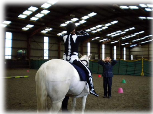
Figuur 7: therapeutische sessie op het paard met speciale ruiterspak die een visuele voorstelling geeft van het skelet

De therapeutische sessies zijn dus bestemd voor alle doelgroepen, maar elke sessie verschilt qua inhoud aangezien elke sessie een één op één begeleiding is en is afgestemd op de persoonlijke noden van de cliënt. Je ziet hier vooral personen met een fysieke beperking, hersenverlamming, aandachtstekortstoornis en autisme aan bod komen, het wordt hen aangeraden door een voorziening of arts. Via leuke oefeningen worden zij aan het werk gezet. Het paard brengt het lichaam in beweging, alle spiergroepen en lichaamsdelen worden hierbij aangesproken en gestimuleerd. Bij de cliënt wordt de coördinatie van deze bewegingen en evenwicht geprikkeld.