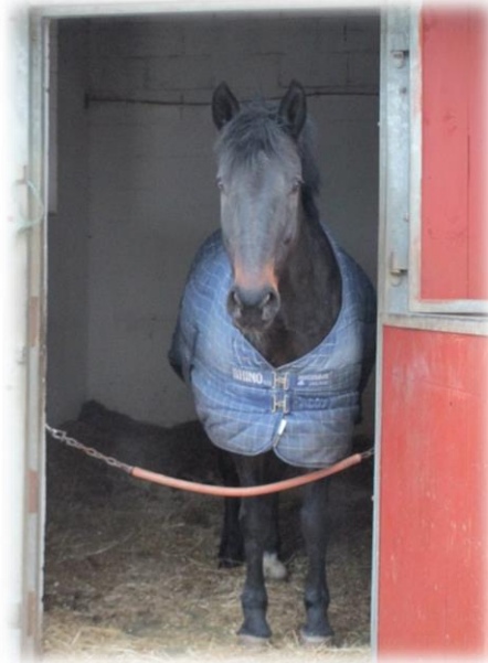
Figuur 6: Ruin Paddy in zijn stal met ketting als afsluiting

Ik vroeg aan Thierry wat het eerste is dat je doet als je deze stal wil ingaan. Hij antwoordde: 'de ketting opendoen.' Ik vertelde hem dat het paard dan zeer snel zou kunnen ontsnappen en dat dit niet de bedoeling is. Ik stelde hem de vraag, wat doe jij als je iemand tegenkomt. 'hallo zeggen.' Dat is wat we ook bij Splash zullen doen. Bij paarden gebeurt dit door uit hun big bubble te blijven (deze loopt van de ene schouder tot de andere) je romp lichtjes naar voren te buigen, je arm uit te steken en een vuist te maken. Wacht even tot hij deze tikt en dan is het oké.