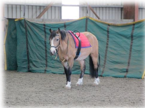
Figuur 10: Therapiepony Maxwell met een rolsingel

Tijdens een therapeutische rijssessie wordt er vaker gebruik gemaakt van een rolsingel dan van een zadel. Dit omwille van de driedimensionale beweging die het paard maakt, dit werd eerder beschreven. Deze heeft meer effect op de cliënt wanneer deze in een rolsingel zit dan in een zadel.