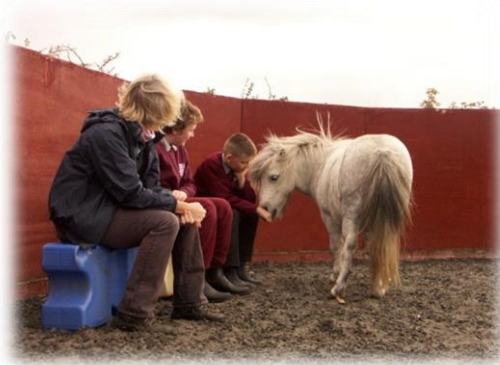
Figuur 2: EAL activiteit in het Equine Facilitated Educational Programme