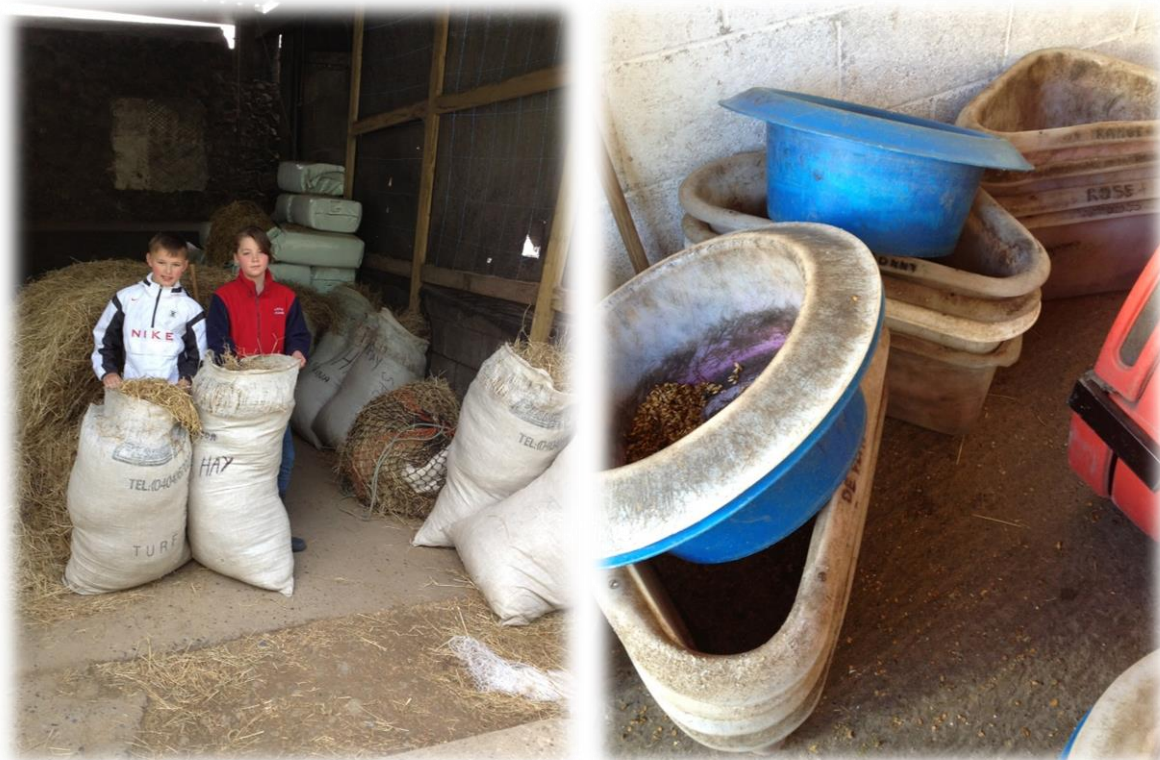
Figuur 5: Hooizakken en avondmaal klaarmaken voor de paarden en pony's

maar ik probeer het geleerde van elke week ook te herhalen. Hier gaat het dan over het borstelen met gebruik van juiste borstels en de waarom erachter. Op en afzadelen komt aan bod. Dit ook met de speciale rolsingel voor personen met een beperking. Als hij in de zomer wil komen helpen zal dit deel uitmaken van zijn taken. Na deze leeractiviteit gaan we opnieuw aan het werk. Het hooi moet gedaan worden, het avondeten van de paarden, de waterdrinkers en eetbakken dienen uitgekuist te worden,... . Al deze activiteiten maken deel uit van het Supported Helpers Programme.