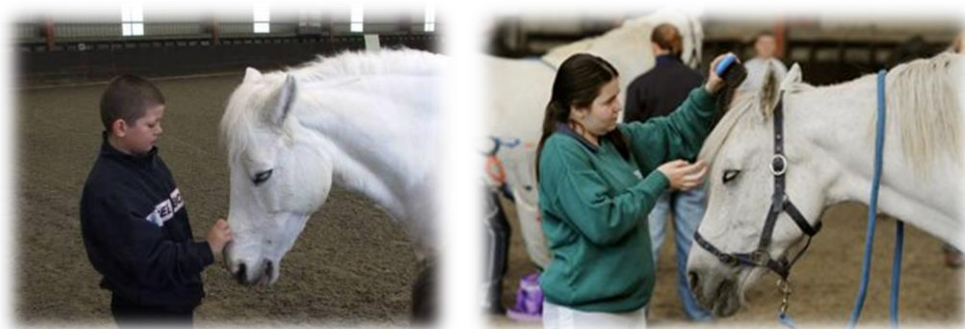
Figuur 1: EAL groepsactiviteit in de piste. Cliënt en pony, één op één

Tijdens de volgende twee sessies had ik het gevoel dat zowel moeder als zoon openstonden voor wat ik te bieden had als paardenverantwoordelijke maar ook als begeleider. Als ik iets aangaf namen ze dit aan, ze gingen hier niet tegenin. Voor mij als begeleider is dit ook aangenaam. Om binnen deze sessies deel te nemen als paardenverantwoordelijke dien je een goede kennis te hebben van paarden en paardengedrag. Je dient hier in te grijpen voor iets gebeurt, proactief tewerk gaan is de bedoeling. Verder is het aangenaam door de deelnemers erkend te worden als een begeleider. Tijdens deze sessies ga ik als begeleider vooral instinctief tewerk en vanuit mijn eigen ervaring. Hier heb ik het dan over de omgang en het werk met de paarden. Wanneer ik de deelnemers begeleid is dit gelijkaardig. Er is echter tijd nodig om voeling te krijgen met hen en duidelijkheid te scheppen in wederzijdse verwachtingen.