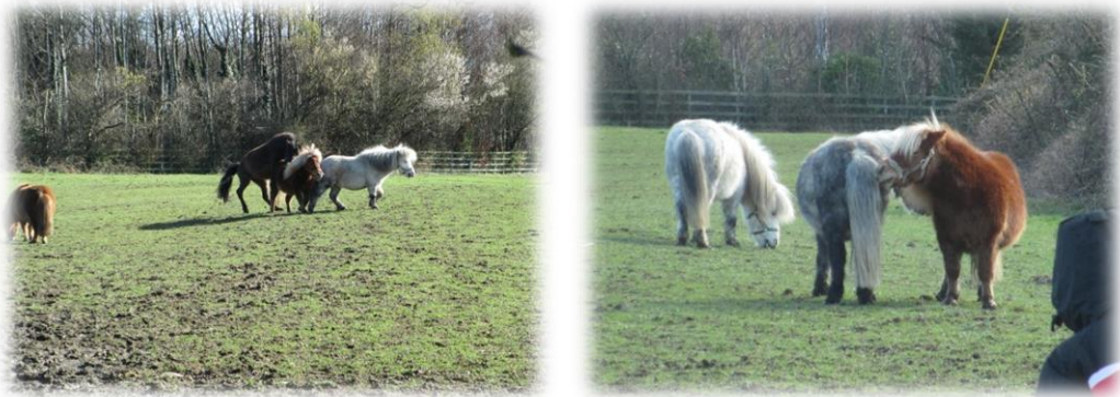
Figuur 3: observeren van paardentaal en communicatie in de weides van Festina Lente

Learning, een oefening uit het vorige programma! We gaan de vijf pony's observeren in hun gedrag en dit gedrag bespreekbaar maken.